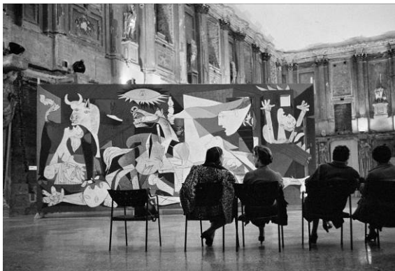
Foto de la sala del Guernica .

Los distintos espacios y recursos expositivos de la muestra descubren el contexto histórico de la época, así como las claves para entender la importancia y el significado del Guernica . La exposición incluye audiovisuales, reproducciones fotográficas y de carteles de la época, y facsímiles de documentos y dibujos que pretenden explicar la historia de la creación y los viajes de una de las obras más representativas del artista más importante del siglo xx.