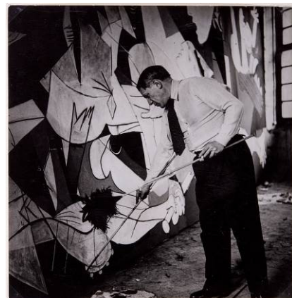
Dora Maar. Picasso de pie trabajando en el Guernica en su taller de Grands-Augustins. © Museo Nacional Centro de Arte Reina Sofía.

Picasso. El viaje del Guernica propone un recorrido histórico de la obra de Picasso desde su creación en París en 1937 hasta su emplazamiento permanente en el Museo Nacional Centro de Arte Reina Sofía, en 1992. Los visitantes podrán descubrir el proceso creativo que llevó a cabo el célebre artista español para realizar su obra, así como su significado de denuncia antibélica y los motivos por los que la obra viajó por todo el mundo durante más de cuarenta años.