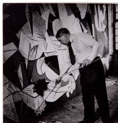
Dora Maar. Picasso de pie trabajando en el Guernica en su taller de Grands-Augustins. © Museo Nacional Centro de Arte Reina Sofía.

Picasso. El viaje del Guernica propone un recorrido histórico de la obra de Picasso desde su creación en París en 1937 hasta su emplazamiento permanente en el Museo Nacional Centro de Arte Reina Sofía, en 1992. Los visitantes podrán descubrir el proceso creativo que llevó a cabo el célebre artista español para realizar su obra, así como su significado de denuncia antibélica y los motivos por los que la obra viajó por todo el mundo durante más de cuarenta años.