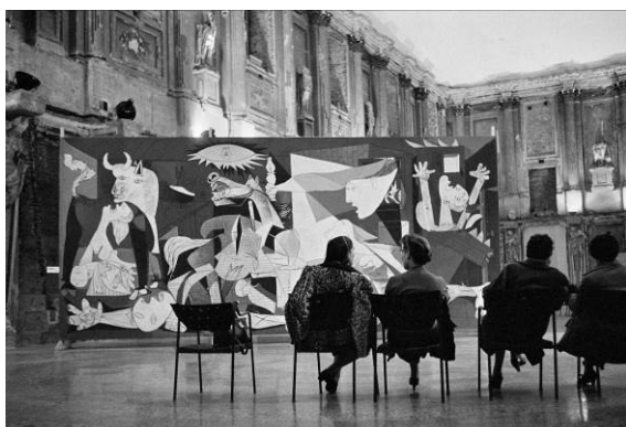
Foto de la sala del Guernica .

Los distintos espacios y recursos expositivos de la muestra descubren el contexto histórico de la época, así como las claves para entender la importancia y el significado del Guernica . La exposición incluye audiovisuales, reproducciones fotográficas y de carteles de la época, y facsímiles de documentos y dibujos que pretenden explicar la historia de la creación y los viajes de una de las obras más representativas del artista más importante del siglo xx.