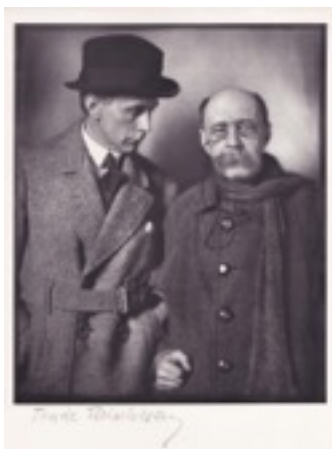
Fotografía de Adolf Loos con Peter Altenberg, 1930 Trude Fleischmann Colección Hummel, Viena.