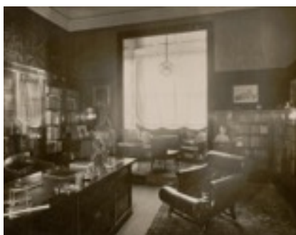
Despacho Casa Friedman The Albertina Museum, Vienna

Esta aproximación entre arquitectura y género y sus diferencias se pueden ver en el contraste entre un despacho de oficina y algunos de los muebles que habrá a la muestra, como escritorios, butacas o librerías, normalmente hechos de maderas más oscuras, en contraposición con los muebles de entorno para la mujer, como tocadores, normalmente de colores más suaves, o con el revestimiento sensual del dormitorio de Lina Loos, su primera mujer, la cual se podrá revivir a través de una fotografía de gran formato que la reproduce.