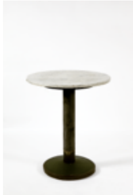
Mesa, 1913 Adolf Loos (atribuida) Colección Hummel, Viena.