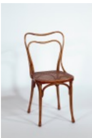
Silla de madera curvada, 1899 Adolf Loos, Colección Hummel, Viena.