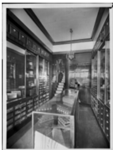
Interior de la planta baja de la tienda Knize, 1910/1913 The Albertina Museum, Vienna

También se podrá ver una maqueta de la Casa Steiner (1910), la cual representa la filosofía Loos, con una fachada austera y que es el resultado de su interior con ventanas que no son propiamente, sino espacios de luz que sirven para iluminar los interiores.