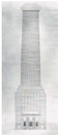
Dibujo del Chicago Tribune Column, 1922 Adolf Loos The Albertina Museum, Vienna

En esta área se podrán ver esbozos y maquetas de proyectos inéditos que nunca se acabaron de realizar, como la mencionada anteriormente del Chicago Tribune Column o la casa de la cantante Josephine Baker (1927) en París, donde el espacio interior vacío es una gran piscina y el revestimiento del exterior en mármol blanco y negro sigue la tradición clásica florentina.