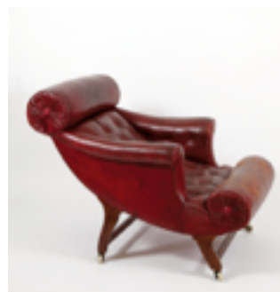
Butaca, 1907 Utilizada por Adolf Loos / F.O.Schmidt Colección Hummel, Viena.