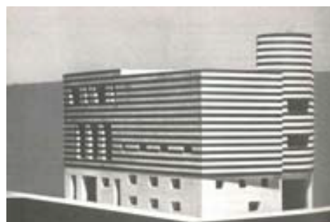
Maqueta de papel de la casa de Josephine Baker, 1927 Adolf Loos CCCB, Barcelona