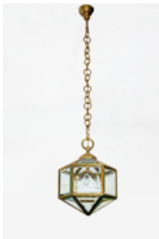
Lámpara de techo, 1905-1913 Adolf Loos Colección Hummel, Viena.