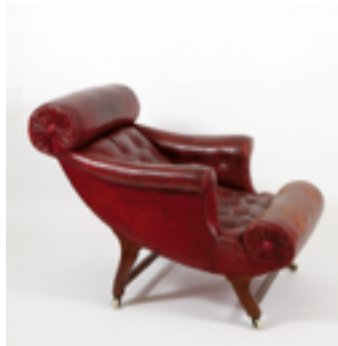
Butaca, 1907 Utilizada por Adolf Loos / F.O.Schmidt Colección Hummel, Viena.