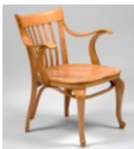
Silla de brazos del Café Capua, 1913 Adolf Loos Colección Hummel, Viena.