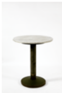
Mesa Café Capua, 1913 Adolf Loos (atribuida) Colección Hummel, Viena.