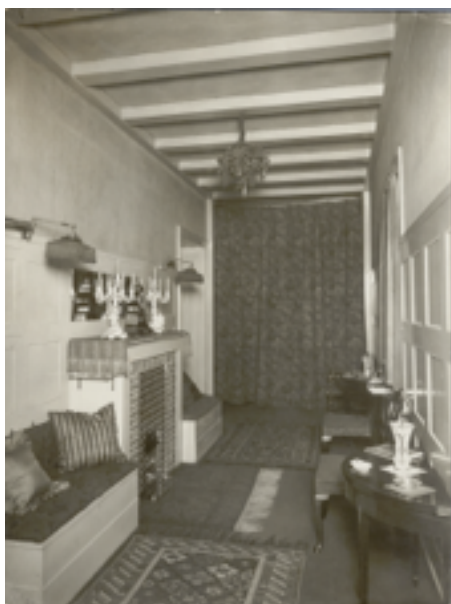
Casa Turnowsky Adolf Loos The Albertina Museum, Vienna

En la Casa Turnowsky, Loos diseña nuevos muebles en blanco de aire minimalista, con cenefas estriadas de cornisa clásica, que tanto aplica a armarios como marcos de espejo que también se podrán ver a la muestra.