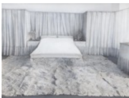
Habitación Lina Loos The Albertina Museum, Vienna