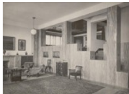
Interior Casa Müller The Albertina Museum, Vienna