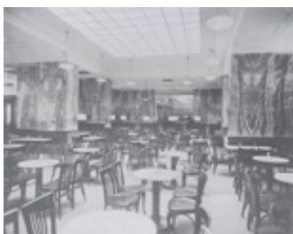
Interior Café Kapua The Albertina Museum, Vienna

Como muestra de esto se podrán ver las maquetas de la Casa Rufer (1922) y la Casa Müller (1930), ambas partiendo de la idea de un cubo que favorece el reparto de las masas y desde donde se busca el vacío interior para crear un espacio de alturas diferentes según el uso que le dé quién lo habita. Esto hace que no haya ni planta baja, ni piso superior ni subsuelo, puesto que cada zona tiene la altura que necesita y los espacios se unen de manera natural y esto se refleja al exterior con la máxima sencillez posible.