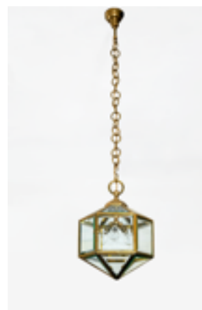
Lámpara de sostre 1905-1913 Adolf Loos Colección Hummel, Viena.