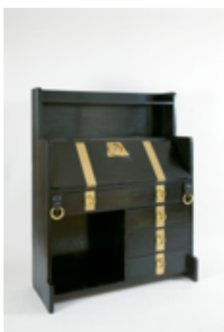
Escritorio 1898/1899 Adolf Loos Colección J Hummel