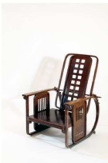
Silla de madera, 1906 Josef Hoffmann Colección J Hummel

Complementan el espacio otros materiales como libros, carteles y dibujos que explican el contexto histórico y el trabajo de coetáneos de Loos, así como un ejemplar de Das Andere (1903), la revista que fundó el arquitecto y que usará como aparato crítico donde cuestionará la forma de vivir burguesa de la época, la inutilidad ornamental de los objetos cotidianos y dónde comparará la cultura occidental del nuevo mundo, Inglaterra y América, con la Viena imperial.