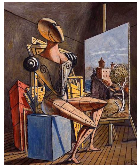
El Contemplador , 1976. Fondazione Giorgio e Isa de Chirico, Roma

El mundo de Giorgio de Chirico. Sueño o realidad reúne un total de 60 obras, procedentes de la Fondazione Giorgio e Isa de Chirico. La muestra reúne las pocas esculturas de De Chirico realizadas a partir de 1940 en terracota y durante los años 1968-1970 en bronce, con unas tiradas limitadas. Esas piezas, junto con una serie de acuarelas, dibujos y litografías que comprenden desde el período metafísico hasta las últimas creaciones gráficas de la neometafísica, amplían y completan esta retrospectiva del mundo de De Chirico, que revive también gracias a unos cuantos dibujos hechos en 1972.