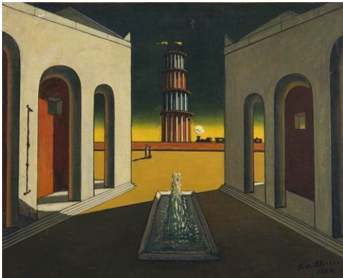
Plaza de Italia con fuente, ca. 1968.