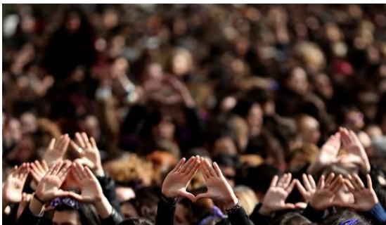
San Sebastián, 08/03/2018. Participantes en la concentración convocada por movimientos feministas en el bulevar de San Sebastián con motivo del Día Internacional de la Mujer. EFE/Juan Herrero.

Tres elementos visuales componen esta instalación envolvente. En primer lugar, unas proyecciones ubicadas en el ámbito superior del espacio muestran los hitos de nuestra memoria colectiva. En segundo lugar, en la parte central de