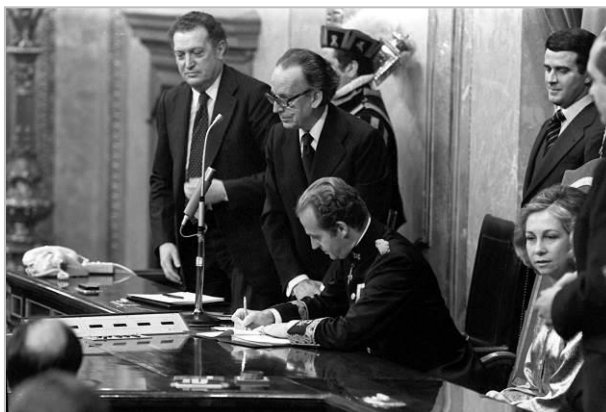
El rey Juan Carlos I firma la Constitución española en el Congreso de los Diputados ante Antonio Hernández Gil, presidente de las Cortes Españolas (centro), y Fernando Álvarez de Miranda, presidente del Congreso (izquierda) y la reina Sofía.

El 6 de diciembre de 1978, un referéndum ratificó la Constitución Española elaborada por las fuerzas representadas en las cortes constituyentes. Para los que lo vivieron en primera persona, fue un acontecimiento único en la historia del país que abrió un largo periodo de convivencia democrática, de esperanzas y de logros, de anhelos y de realidades. Para otros que nacieron y crecieron con ella, forma parte de una realidad cotidiana; participan y defienden sus valores.