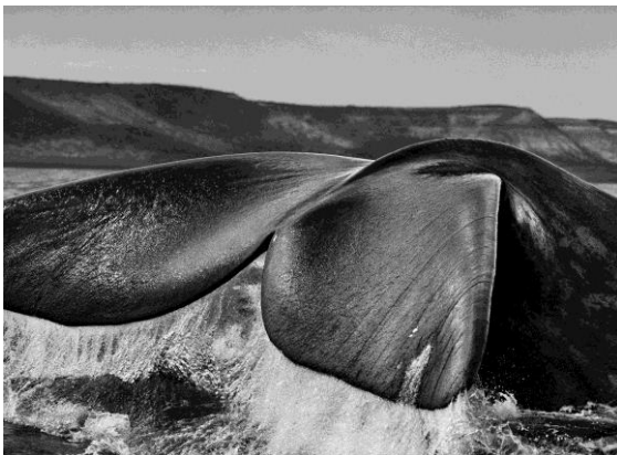
Las ballenas francas australes ( Eubalaena australis ), atraídas a la península Valdés por el cobijo que les brindan sus dos golfos, el de San José y el Nuevo, suelen nadar con la cola erguida fuera del agua. Península Valdés. Argentina. 2004.

El propio fotógrafo lo explica así: «Mis proyectos anteriores fueron periplos a través de las tribulaciones de la humanidad. Este, sin embargo, fue mi homenaje al esplendor de la naturaleza. Al viajar a pie, en embarcaciones, avionetas o globos, mientras fotografiaba volcanes, icebergs, desiertos y junglas contemplé un mundo que no ha cambiado en milenios. Además, con los animales en su hábitat natural, desde pingüinos, leones marinos y ballenas del Antártico y el Atlántico Sur hasta leones, ñúes y elefantes de África, sentí que era un privilegio contemplar los ciclos de la vida en continua repetición».