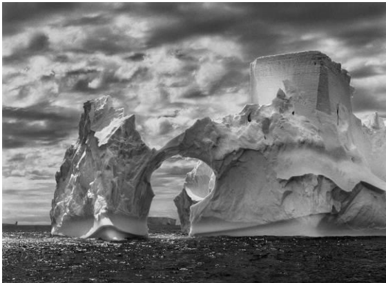
Iceberg entre la isla Paulet y las islas Shetland del Sur, en el mar de Weddell. Cerca de la superficie, los niveles de flotación anteriores son claramente visibles en el hielo, que ha sido pulido por el movimiento constante del océano. En lo alto, una forma semejante a la torre de un castillo ha sido tallada por la erosión eólica y las piezas adosadas de hielo. Península Antártica. Enero y febrero de 2005.

A finales de 1990, tras varias décadas de trabajo en todo el mundo fotografiando las grandes transformaciones demográficas y culturales de nuestro tiempo, Sebastião Salgado regresó a su lugar natal, una finca ganadera en el valle del río Doce, en el estado de Minas Gerais, en Brasil. Las tierras antes fértiles, rodeadas de vegetación tropical, con una exuberante diversidad de especies vegetales y animales, habían sido víctimas de un proceso de deforestación y erosión. La naturaleza parecía agotada. Su esposa, Lélia Wanick Salgado, tuvo la idea de