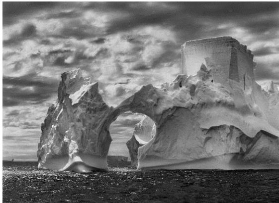
Iceberg entre la isla Paulet y las islas Shetland del Sur, en el mar de Weddell. Cerca de la superficie, los niveles de flotación anteriores son claramente visibles en el hielo, que ha sido pulido por el movimiento constante del océano. En lo alto, una forma semejante a la torre de un castillo ha sido tallada por la erosión eólica y las piezas adosadas de hielo. Península Antártica. Enero y febrero de 2005.

A finales de 1990, tras varias décadas de trabajo en todo el mundo fotografiando las grandes transformaciones demográficas y culturales de nuestro tiempo, Sebastião Salgado regresó a su lugar natal, una finca ganadera en el valle del río Doce, en el estado de Minas Gerais, en Brasil. Las tierras antes fértiles, rodeadas de vegetación tropical, con una exuberante diversidad de especies vegetales y animales, habían sido víctimas de un proceso de deforestación y erosión. La naturaleza parecía agotada. Su esposa, Lélia Wanick Salgado, tuvo la idea de