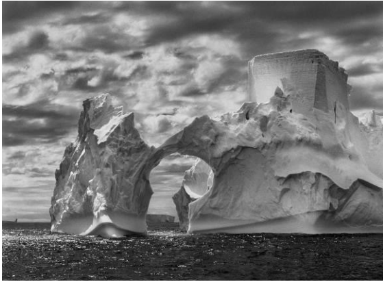
Iceberg entre la isla Paulet y las islas Shetland del Sur, en el mar de Weddell. Cerca de la superficie, los niveles de flotación anteriores son claramente visibles en el hielo, que ha sido pulido por el movimiento constante del océano. En lo alto, una forma semejante a la torre de un castillo ha sido tallada por la erosión eólica y las piezas adosadas de hielo. Península Antártica. Enero y febrero de 2005.